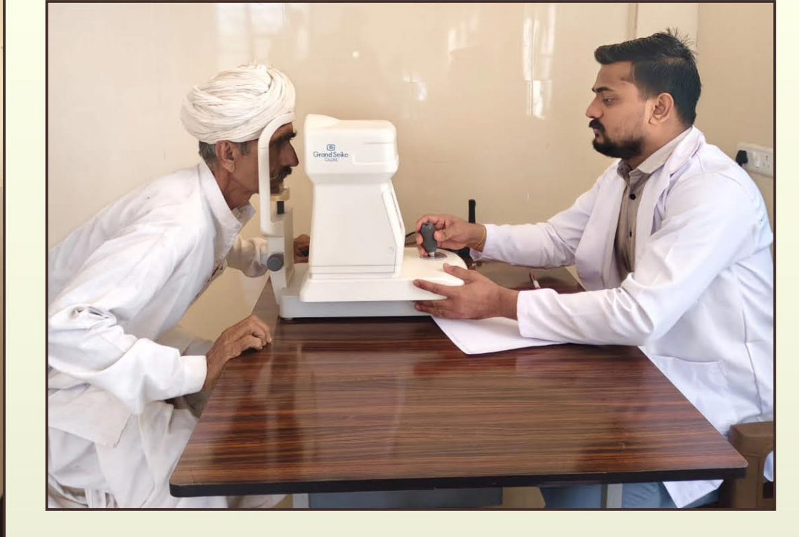
निःशुल्क नेत्र जांच शिविर डंडाली