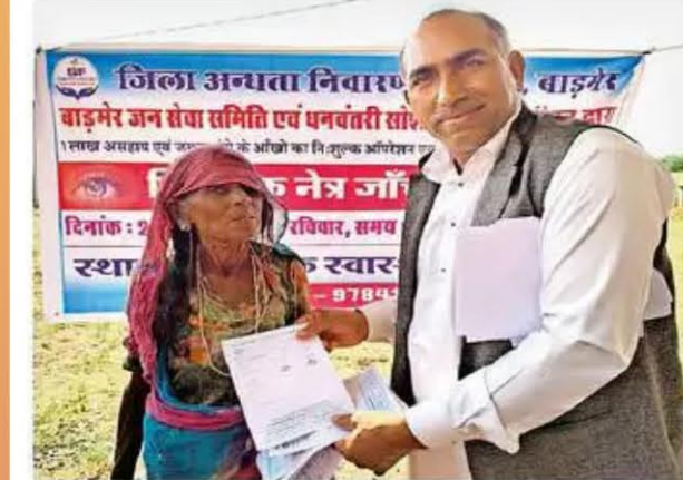
आंखों की जांच कर चर्बनित को प्रमाण पत्र देते हुए